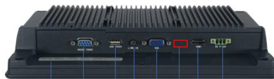
OSD Function key RS232 Touch USB Touch Audio In VGA DP HDMI DC 9-36V